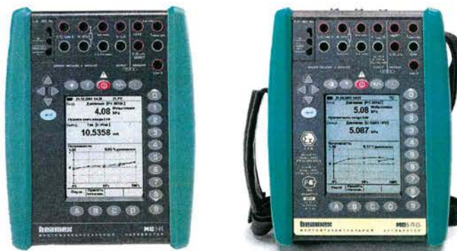
Рисунок 1 – Общий вид калибраторов MC5-R, MC5-R-IS

Фотография общего вида калибраторов и место нанесения поверительного клейма-наклейки представлены на рисунках 1-3 .