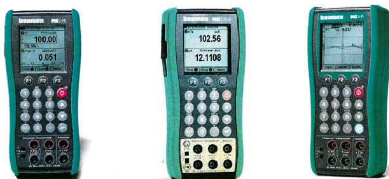
Рисунок 2 – Общий вид калибраторов MC2-R, MC2-R-IS, MC4-R