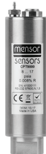
Высокоточный датчик давления, модель СРТ9000