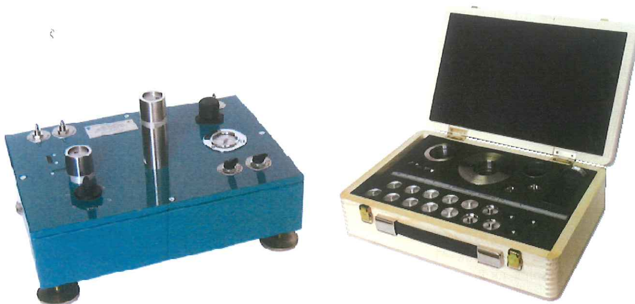
Рисунок 1 – Общий вид калибраторов

Общий вид калибраторов приведен на рисунке 1.